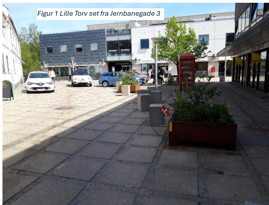
Figur 1 Lille Torv set fra Jernbanegade 3

Vi ønsker et grønt byrum på ”Lille Torv” af samme årsager som vi ønsker en grøn slotsby. Det skal være et sted for mennesker i alle aldre, hvor vi kan lide at komme og være under trygge former.